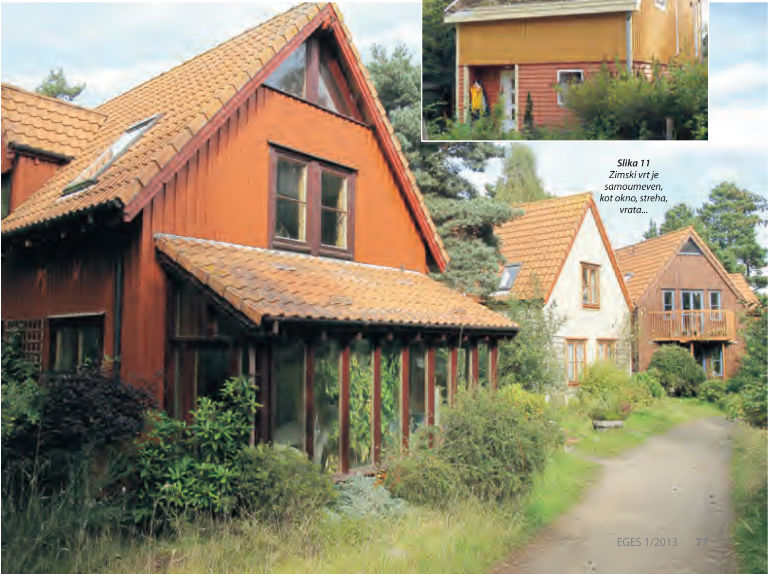
Slika 11 Zimski vrt je samoumeven, kot okno, streha, vrata...