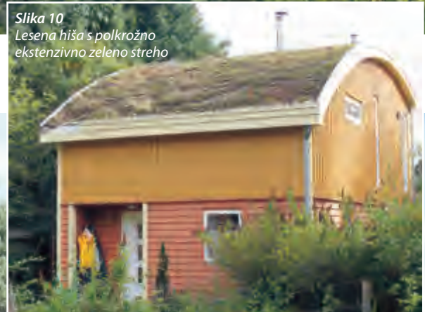
Slika 10 Lesena hiša s polkrožno ekstenzivno zeleno streho