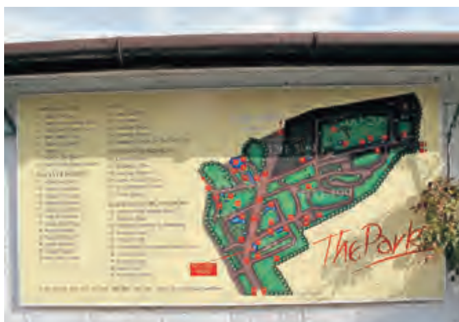
Slika 2 Situacijski načrt Findhorna z opisom ključnih točk v naselju

Identiteto naselja opredelijo stavbe in ulice, odprte in zelene površine, javni in zasebni objekti,