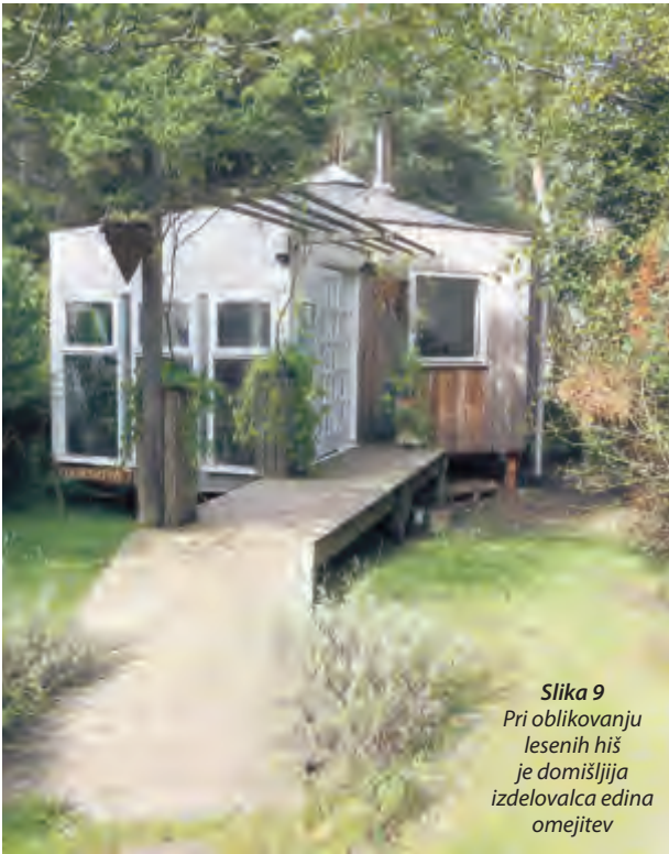
Slika 9 Pri oblikovanju lesenih hiš je domišljija izdelovalca edina omejitev